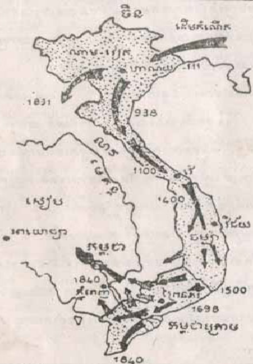
• ដំណើរសម្រុកចុះមកនិសង្កាត់គ្រប់ • - 111 មុនគ.ស. មក 1840 តើយូរសម្រុកទៅទិសណាទៀត ?