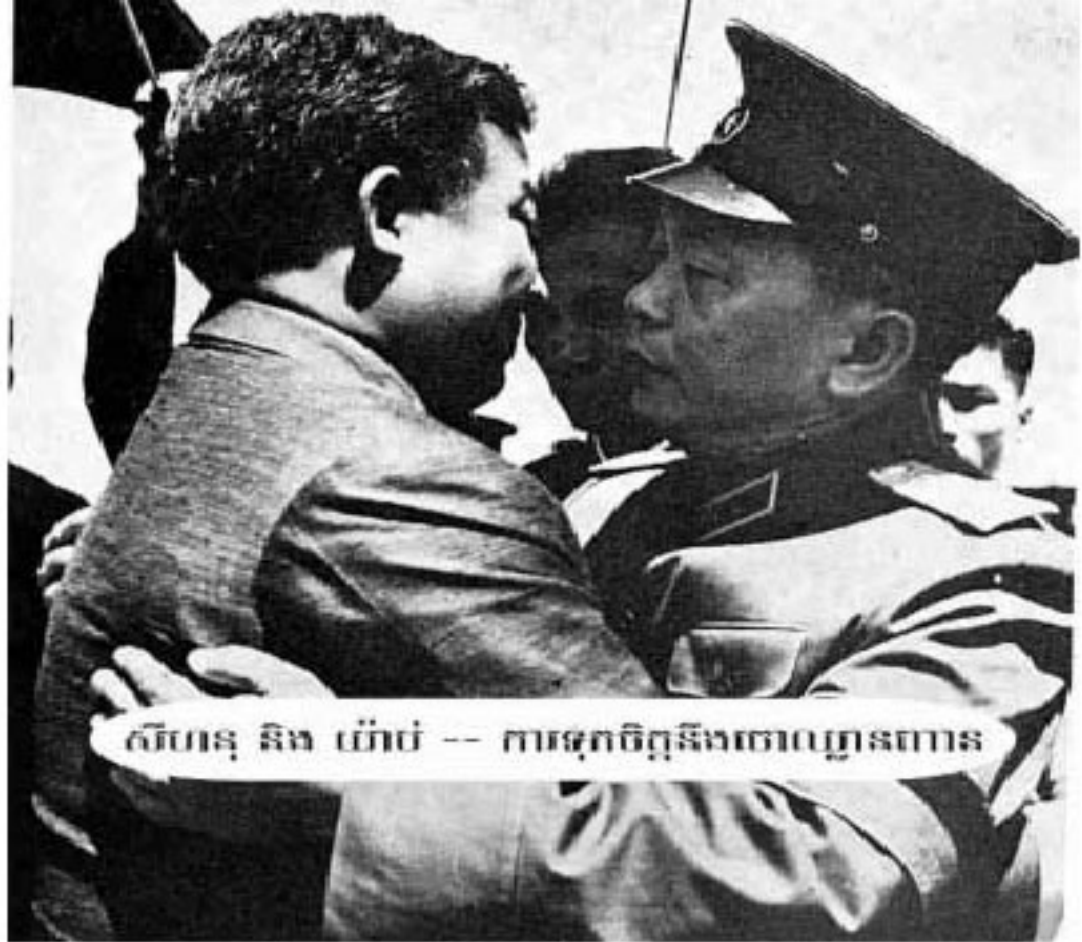
សិហានុ និង យ៉ាប៉េ -- ការទុកចិត្តនិងចោលប្រារព្ធពារ