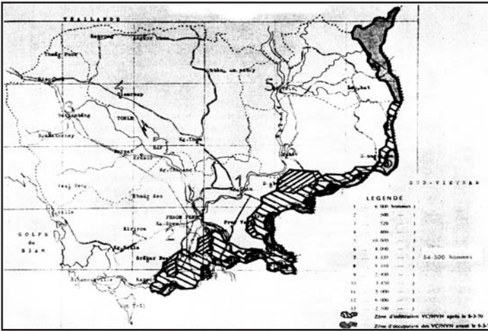
ផែនទីបង្ហាញទីតាំងរបស់យៀកកុងនៅក្នុងទឹកដីខ្មែរទិសខាងកើត

( កកន ៖ សីហនុជាមនុស្សចេះធ្វើភ្លើ... ឬក៏ជាមនុស្សភ្លើធ្វើចេះ ? ចុះ កោះត្រល់...យួនវាមិនទាមទារ? ហើយព្រះវិហារ...សៀមវាមិនទាមទារ? ចុះនៅក្នុងឆ្នាំ១៩៦៧... នៅជួរព្រំប្រទល់ដែនកម្ពុជាផ្នែកខាងកើត តាំងពី រតនៈគីរី, មណ្ឌលគីរី, ក្រចេះ, កំពង់ចាម, ស្វាយរៀង, ព្រៃវែង, តាកែវ, កំពត... មិនមែនជាជំនីតាំងយៀកកុងដ៏សម្បើមដាច់កន្ទុយភ្នែកទេឬ ?