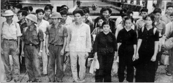
ពួកច្រកក្នុងទាំងអស់នេះ បានត្រូវគេចាប់យកមកបង្ហាញសីហនុ នៅដំរីងភ្នំពេញ រួចបន្តបន្ទាប់មកត្រូវគាត់បញ្ជាឲ្យដោះលែងទៅវិញ ?!

«ដូច្នោះ នៅថ្ងៃដែលព្រះអង្គធ្វើដំណើរចាកចេញទៅប្រទេសបារាំង (៦មករា១៩៧០) អំពើបាបនិងឧក្រិដ្ឋកម្មទាំងប៉ុន្មាន ត្រូវព្រះអង្គបានបំពេ ញរួចអស់ហើយ ។ សម្តេចសីហនុព្រះប្រមុខរដ្ឋ បានលក់ជាតិរបស់ទ្រ ង់រួចទៅហើយ ។»