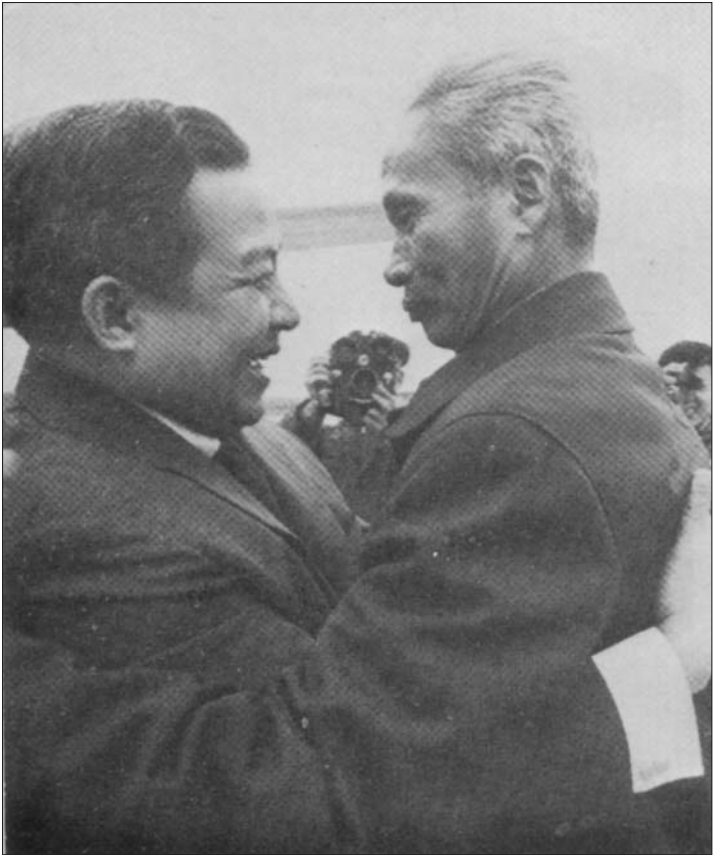
ភ្នែកជាំ-ហ្មាំងដុំដុំសម្លឹងស្តេចសីហនុ ជាភ្នែកមុតរបស់ផ្តែចចក់ដែលចាំតែត្របាក់ស៊ីក្នុងចៀម... ចំណែកស្តេចសីហនុជាស្តេចភ្លើង លើកដីឲ្យយួនហើយនឹកស្មានថាយួនជាអ្នកមានគុណ... ស្មានតែយួនវាជួយឲ្យរំដោះពីលន់-ឈប់ហើយនិងអាមេរិកាំង ជាពិសេសស្មានតែយួនវាព្រមគោរពព្រំដែនខ្មែរ ដូចតាមពាក្យសន្យា ។

យមានសរសេរវិចារណកថាមួយដ៏ប្រិមប្រិយ ចុះហត្ថលេខាដោយនរោត្តម-សីហនុផ្ទាល់ មានចំណងជើងថា «ការរាតត្បាត» (La Curée) ដោយបញ្ជាក់ថា «ពេលអាមេរិកាំងចេញផុតពីដែនដីឥណ្ឌូចិន រៀតណាមខាងជើង នឹងធ្វើការរាតត្បាតទៅលើប្រទេសកម្ពុជាគ្មានសល់អីឡើយ» ។ ម្តងឃើញដូច្នោះ...ម្តងឃើញដូច្នោះ ។ តាមពិតស្តេចសីហនុជាមនុស្សឆ្លាតសុខសាធ សមតែយកទៅឲ្យហ្វូងខ្មែរភ្លើង ពីព្រោះលទ្ធផលចុងចប់ទៅ ប្រទេសកម្ពុជាត្រូវរលត់រលាយអស់, ទីក្រុងនិងខេត្តខ្មែរដែលបានសាងឡើងជិត១០០ឆ្នាំ នៅក្រោមរដ្ឋការបារាំង បានក្លាយទៅជាផេះ ។ ចំណែកប្រជាពលរដ្ឋខ្មែរបានត្រូវស្លាប់អស់២-៣លាននាក់ ដោយសារតែស្នាដៃរបស់មនុស្សឆ្លាត ដែលមានឈ្មោះថា នរោត្តម-សីហនុ ។ មនុស្សម្នាក់នេះ ជាមនុស្សឆ្លាតមែនទែន មិនមែនជាមនុស្សឆ្លាតមានបញ្ញាដូចដែលគាត់បានអួតអាងនោះទេ ( un fou génial !! ) ។ ពីព្រោះថា នៅក្នុងឆ្នាំ១៩៦៩ ស្តេចសីហនុខ្លួនឯង ជាអ្នកប្រើលោកលន់-ឈប់ដេញយួន ។ ស្រាប់តែនៅឆ្នាំ១៩៧០ នៅពេលដែលលន់-ឈប់កំពុងជាប់ដៃធ្វើនយោបាយដេញយួន សីហនុទោលន់-ឈប់ថាជាជនក្បត់ ។ ស្នាដៃ