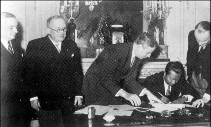
ព្រះអង្គម្ចាស់ ស៊ីសុវត្ថិ-មុនីពង្ស កំពុងចុះហត្ថលេខា រូបថតឯកសារជាភស្តុតាងដឹកស្រង់ចេញពីសៀវភៅរបស់ស្តេចសីហនុ «Souvenirs doux et amers»

តាមពិត ការចុះហត្ថលេខាលើសន្ធិសញ្ញាបារាំង-ខ្មែរក្នុងឆ្នាំ១៩៤៥ ពុំមែនជា ទង្វើរបស់ស្តេចសីហនុទេ តែជាទង្វើរបស់ព្រះអង្គម្ចាស់ ស៊ីសុវត្ថិ-មុនីពង្ស ។