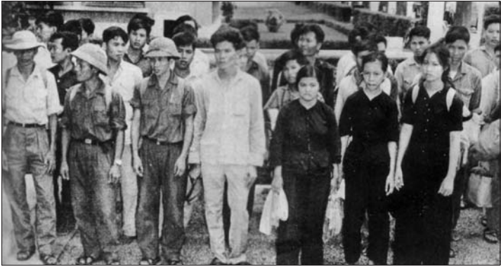
ប្តីប្រពន្ធនិងកូនៗរបស់លោកស្រី ហ៊ុន សែន ក្នុងឆ្នាំ ១៩៧៥ ក្នុងរយៈពេលដែលលោកស្រី ហ៊ុន សែន កំពុងរស់នៅក្នុងប្រទេសកម្ពុជា។