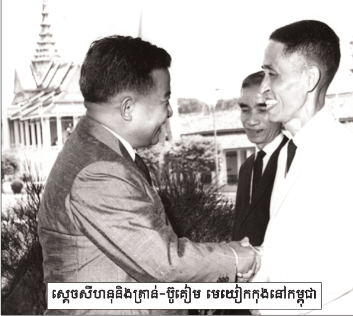
ស្តេចសីហនុនិងត្រាស់-ប៊ូគៀម មេឃ្លៀកកុងនៅកម្ពុជា