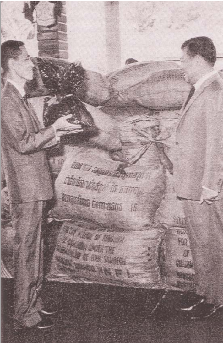
ក្នុងថ្ងៃទី២៤ ឧសភា ១៩៦៥, ឧត្តម-សីហនុប្រគល់អំណោយទៅត្រាស់-ប៊ូគៀម ដែលជាតំណាងនៃរណសិរីរុំយៀកកុងប្រចាំកម្ពុជា ។

ទាំងនេះប្រហែលអាចបញ្ជាក់បានថា សីហនុមានបំណងយ៉ាងច្របូបច្រាវដើម្បីឲ្យរណសិរីរុំយៀកកុង យកជ័យជំនះលើរដ្ឋាភិបាលស្របច្បាប់នៅព្រៃគុក ដែលគាំទ្រដោយស.រ.អា. ។ ហើយបើជាការពិតមែន គឺគឺ