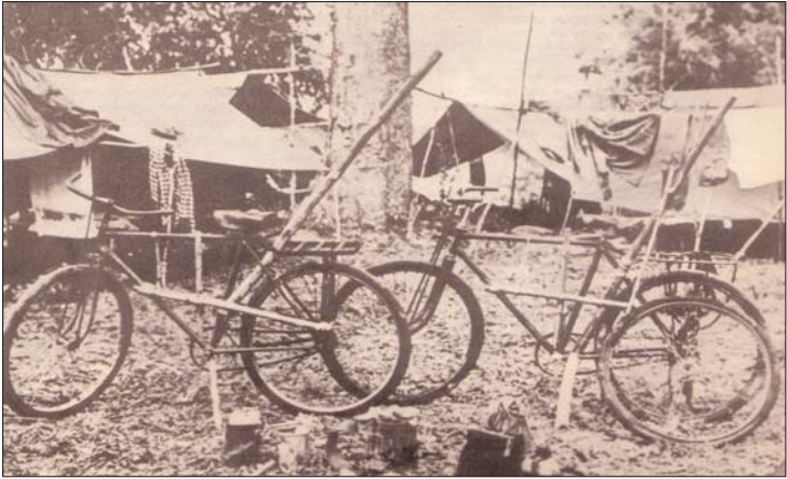
ទិដ្ឋភាពមូលដ្ឋានកងទ័ពយៀកកុង-យៀកណាមខាងជើងនៅក្នុងខែត្រូវតនគីរី