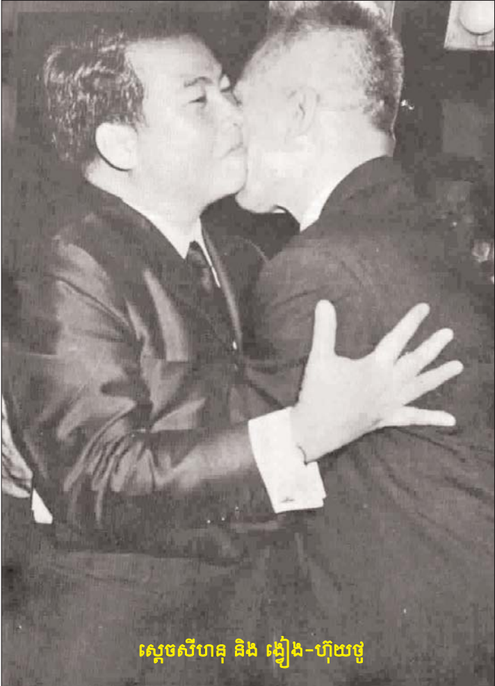
ស្តេចសីហនុ និង ភ្ញៀវ-ហ៊ុយចូ